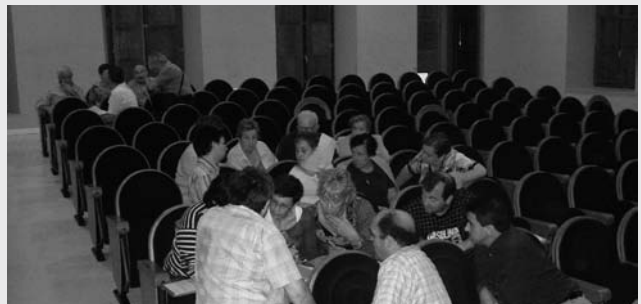
II Foro de participación ciudadana 10.06.2009

Durante los meses de noviembre y diciembre se realizaron encuestas y entrevistas de participación ciudadana a los habitantes de Ramales de la Victoria en todo el territorio municipal (Ramales de la Victoria, Cubillas, Entrepuentes, Guardamino, Helguero, Iseña, El Mazo, La Pared, Salto del Oso, Sierra Alcomba, Los Valles, Veares y Vegacorredor y en Gibaja en Bárcena, La Estación, Pondra, La Quintana y Riancho).